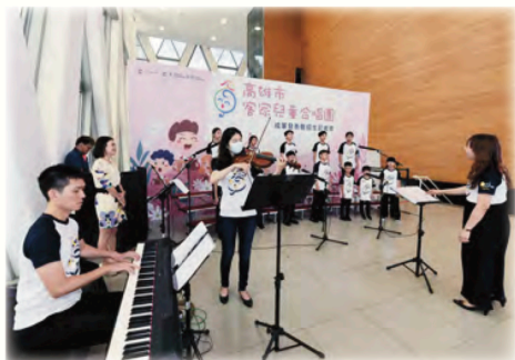
2023成軍發表暨招生記者會