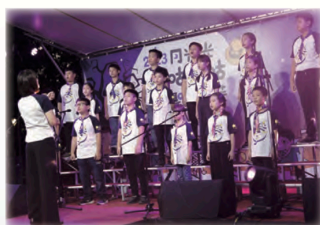
2023月光光咿咿咕咕萬聖嘉年華