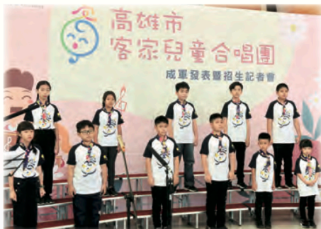
2023成軍發表暨招生記者會